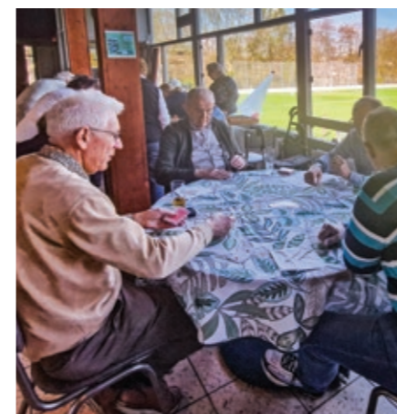
Er is nog plek voor meer klaverjassers.