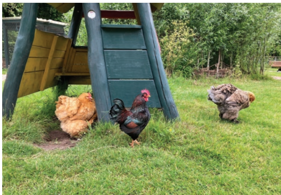
De kippen mogen weer in wei scharrelen.

Op 13 juli is het 13 jaar geleden dat De Nijkamphoeve een BuurtBoerderij werd. 13, zou dat echt een ongeluksgetal zijn? Je zou het bijna gaan geloven want ook in het tweede kwartaal van het 13de jaar als BuurtBoerderij ging het niet met alle dieren goed. Kat Nala bleek een niet behandelbare tumor te hebben, ezel Tukker leed aan een pijnlijke ongeneeslijke kwaal en kip Jip was ook niet in orde. Laten inslapen was voor deze drie de enige dierwaardige oplossing. Ezel Maaïke, een krasse eenogige tante van 28, kreeg last aan dat ene oog. Maar dat was behandelbaar.