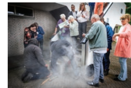
Met wat herrie en stof kwam ook de Gulden Klinker van het naaiproject op zijn plek.

netjes in te krijgen. Daarna werd er getoost op een mooie voortzetting van het project en werd er een prachtige taart aangesneden.