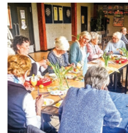
Veel enthousiasme voor het maken van paasdecoraties.