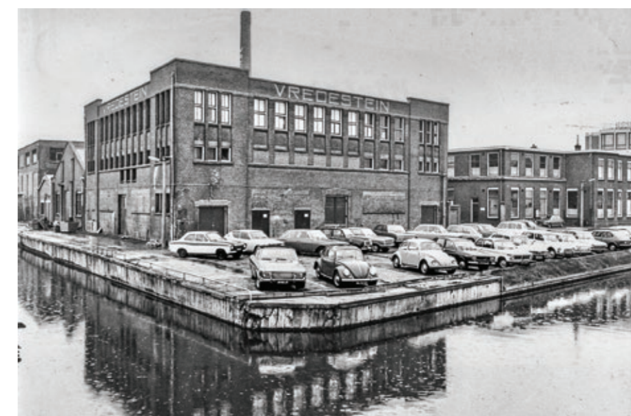
De Vredesteinfabriek rond 1974