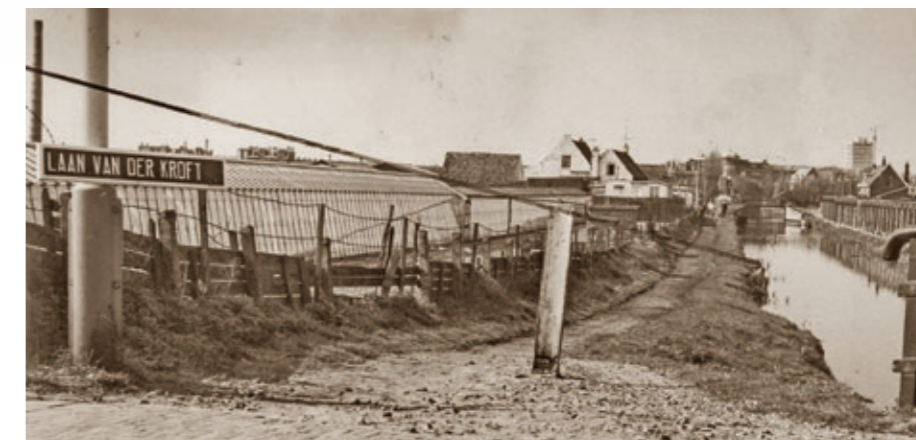
Laan van der Kroft rond 1969

voor ouderen in de buurt heeft willen realiseren. Maar wel is hij er tevreden over dat er in de nieuwbouw naast vrijesectorwoningen ook middeldure woningen en sociale huurwoningen komen. Want ook jonge zorgmedewerkers en politiemensen moeten kunnen wonen.