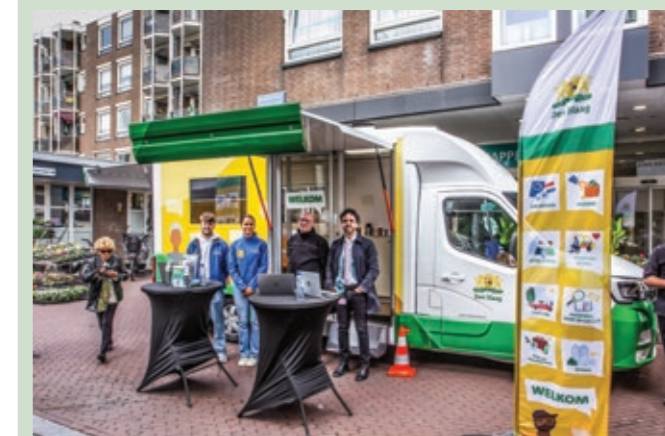
De mensen van het Info-busje staan elke woensdag voor u klaar.

Ik wilde graag een breed informatiepunt, omdat ik weet, dat bewoners behoefte hebben aan informatie en ook graag iemand face-to-face willen spreken. Het is nu nog geen breed infopunt, maar het busje staat er. We zijn op weg om een pand te vinden, waar dit infopunt dagelijks open is met verschillende 'ingrediënten'. Een geweldige vorm van participatie en de Commissie als initiatiefnemer is hier trots op.