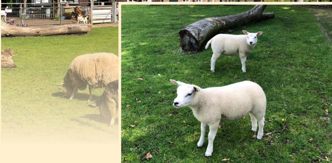
Lorelei en Nana

Om met het mooiste nieuws te beginnen, er zijn weer lammetjes op De Nijkamphoeve. In de lente horen lammetjes er ook gewoon bij.