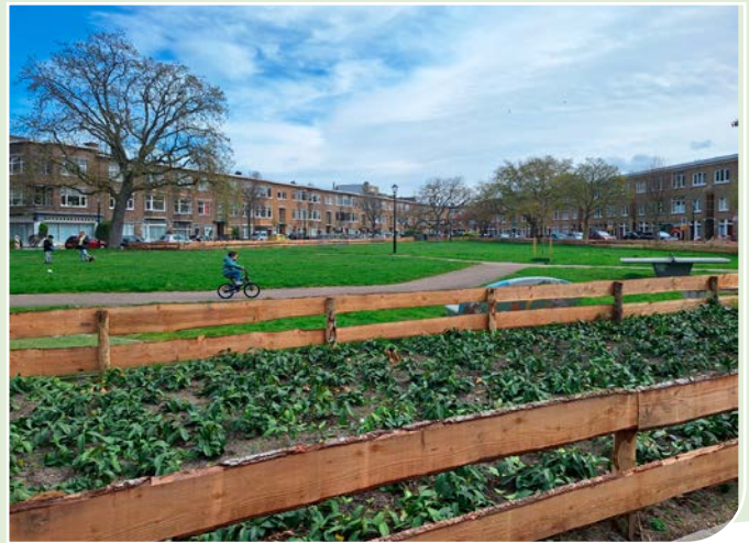
Het Notenplein is in overleg met de buurt opgeknapt.

De Notenbuurt is ook een zeldzaam gaaf voorbeeld van de verzuiling met voor iedere zuil een eigen contingent aan woningen met bijbehorend groen. Zo is er een protestants, een liberaal, een socialistisch en een katholiek bouwblok. Dit laatste blok wil Haag Wonen slopen. We zijn benieuwd wat de Paus daarvan vindt! Om maar niet te spreken over