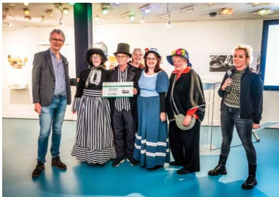
Vrijwilligers van het Dickens Naaiproject nemen hun prijs in stijl in ontvangst.

Vol spanning verzamelden vele vrijwilligers zich bij restaurant Gember. Zij waren genomineerd voor de Gulden Klinker. De Gulden Klinker is een straatsteen met een verguld plaatje erop. Deze wordt door de gemeente op de plek van het project geplaatst. Zo kan iedereen zien dat daar gewerkt wordt aan een prettige buurt of straat. Bij de Gulden Klinker hoort een waardebon van € 1.000. Dat geld mogen de winnaars gebruiken voor hun project.