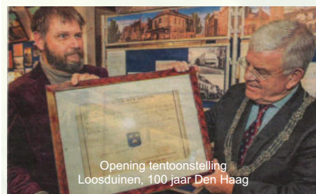
Opening tentoonstelling Loosduinen, 100 jaar Den Haag

Het Loosduins museum herbergt gelukkig veel spullen van ons verleden, ons Loosduins erfgoed, en de nieuwe tentoonstelling 'Loosduinen, 100 jaar Den Haag', geeft dit goed weer. Op de foto de officiële openingshandeling door burgemeester Jan van Zanen.