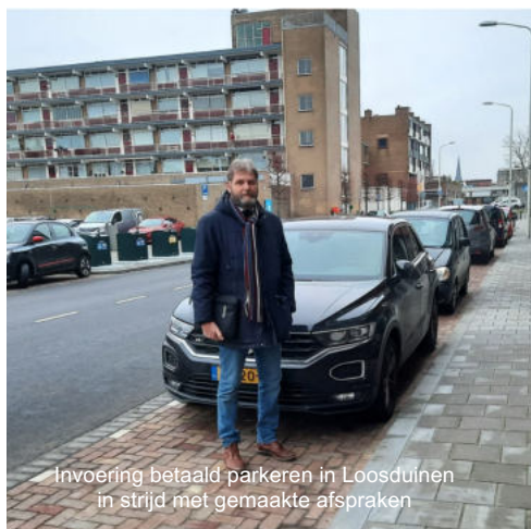
Invoering betaald parkeren in Loosduinen in strijd met gemaakte afspraken