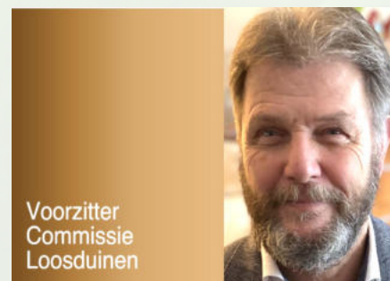
Voorzitter Commissie Loosduinen

dorp Loosduinen op te geven en tot Den Haag te gaan behoren. Sinds 1811 was het dorp zelfstandig (na de Franse bezetting). Echter, 'de grote broer' Den Haag had al de nodige vierkante meters van het oorspronkelijke Groot Loosduinen 'ingepikt' voor de stadsuitbreiding. Na de annexatie kregen de Loosduiners er wel wat voor terug. De infrastructuur werd verbeterd, er kwam een riolering en er hoefde niet meer geolod te worden op het open water. Daarnaast bleven zij wel invloed houden via de Commissie Loosduinen. De leden daarvan kwamen uit de tuinbouw, de landbouw en uit het veilingwezen. Uiteindelijk was Loosduinen een tuindersdorp en speelde deze bedrijfstak een belangrijke rol. Zie ook informatie over de tentoonstelling 'Loosduinen, 100 jaar Den Haag' in column hiernaast.