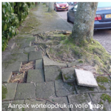
Aanpak wortelopdruk in volle gang

Zoals op diverse plaatsen in de wijk al is te zien is er een herstelslag gaande wat betreft het straatwerk. Er wordt extra onderhoud uitgevoerd onder meer van de stoepen. Op tal van plekken is namelijk rondom bomen sprake van wortelopdruk. Hierdoor worden tegels en stoepranden alle kanten opgeduwd. In de Architectenbuurt is al het nodige gerepareerd en in de Mensenrechtenbuurt gaan de werkzaamheden binnenkort van start. Opvallend veel werk is ook verricht aan het groenonderhoud in de wijk. Het is duidelijk dat er meer aandacht aan het onderhoud van