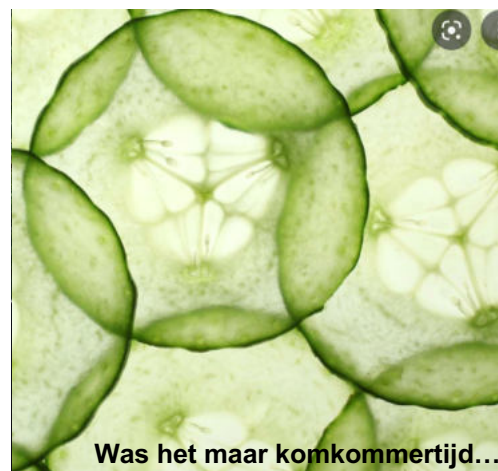
Was het maar komkommertijd...