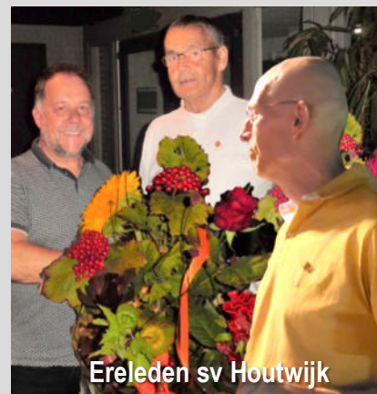
Ereleden sv Houtwijk