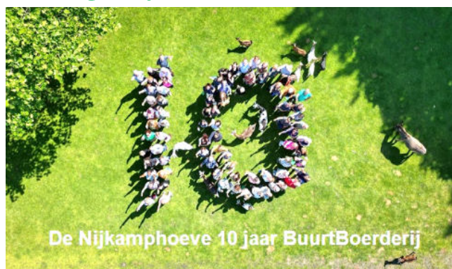
De Nijkamphoeve 10 jaar BuurtBoerderij

Wat een zomer. De Nijkamphoeve bestond 10 jaar als BuurtBoerderij. Dus een officiële receptie voor relaties en later een lustrumfeest met meer dan 500 bezoekers. Ons hitteplan moest deze zomer van kracht worden. Toen het echt heet was ging de boerderij eerder of zelf helemaal dicht voor bezoekers, zodat de dieren in alle rust de schaduw konden opzoeken. De ganzen Gijs en Sjakie zijn vertrokken. Zij zaten al maanden opgehokt. Vanwege vogelgriepmaatregelen zou dat nog maanden zo blijven. We hebben ze voor hun welzijn naar Akka's Vogelparadijs in Drenthe gebracht. De konijnen Jive en Teddy hadden zulke ouderdomsklachten dat we ze hebben laten inslapen. Balou en Snuffy zijn hun vervangers. Ezel Igor