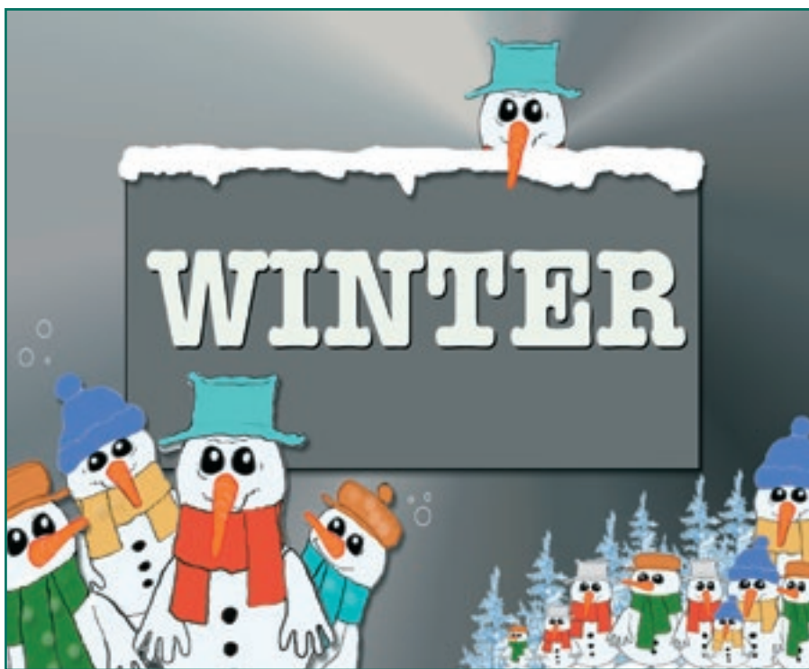
Illustratie: Cees Willemse

Zie voor ‘Agenda’ onze website: www.wijkberaadhoutwijk.nl/agenda