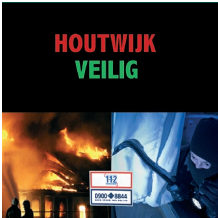
Illustratie: Cees Willems

zogenoemde vuurtonnen of vuurkorven. De politie zal hier streng op handhaven en de verantwoordelijken kunnen een forse boete tegemoet zien. Ook zal eventuele schade aan het wegdek of aan het straatmeubilair - zo mogelijk - op de daders worden verhaald. In de aanloop naar oud en nieuw toe zullen we zo veel als mogelijk opgeslagen materiaal bestemd voor een vreugdevuur opsporen en af laten voeren. Ook hier kunnen de verantwoordelijken fors beboet worden. Dit uiteraard omdat opslag van brandbaar materiaal bijna altijd brandgevaarlijke situaties oplevert. Weet u waar dergelijk materiaal ligt opgeslagen? Meld dit dat bij ons of desgewenst via de Meld misdaad anoniemlijn op 0800-7000.