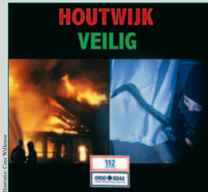
Illustratie: Cees Willems

historisch laag niveau ligt. Wel benadrukten zij dat er rekening mee moet worden gehouden dat dit in de winter kan gaan aantrekken. De bewoners werden dan ook gevraagd om voortdurend mee te helpen aan het terugdringen van het aantal inbraken in hun directe woonomgeving. Tips in dit verband: zorg tijdig voor deugdelijk hang- en sluitwerk en laat lijken alsof u thuis bent (gebruik tijdschakelaars) en sein bij afwezigheid burens in. Maak het inbrekers niet te gemakkelijk en bel direct 112 als u iets verdachts ziet. Meer informatie: http://www.denhaag.nl/home/bewoners/to/Tips-tegen-woninginbraak.htm