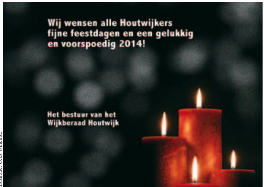
Illustratie: Cees Willemsse